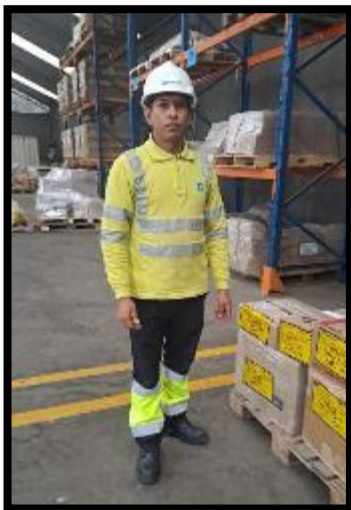
Forma correcta de vestimenta