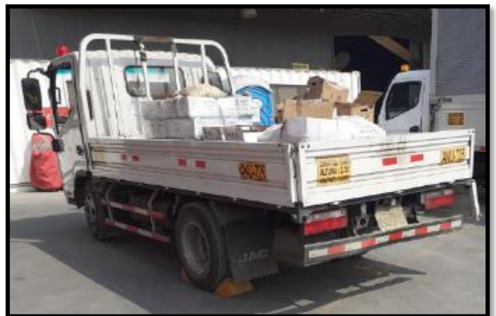
Vehículo con Circulina en mal estado no ingresa