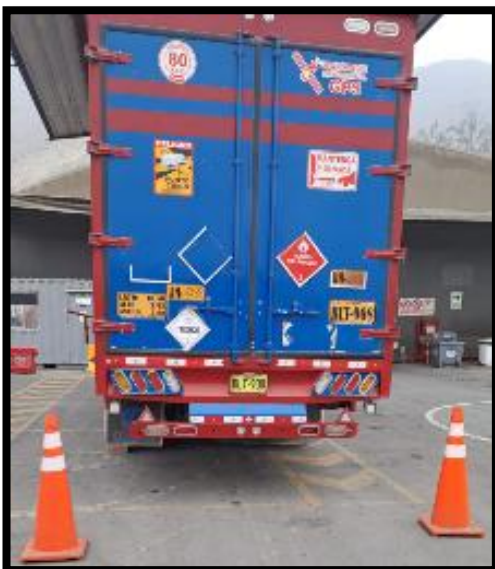
Conos, cintas reflectivas y tacos en buen estado