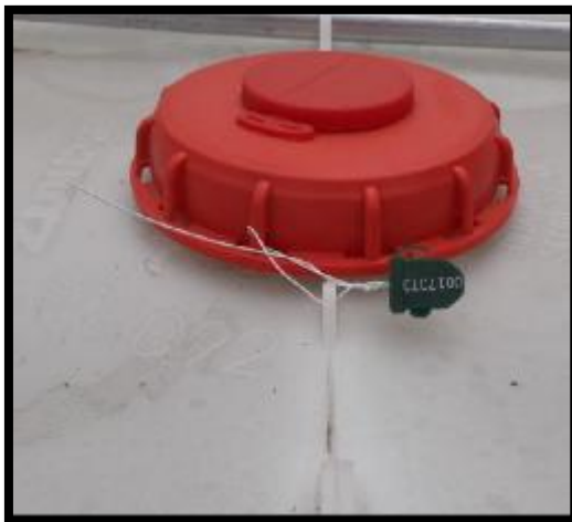
Colocación de precintos en big bag y Hoover (IBC)