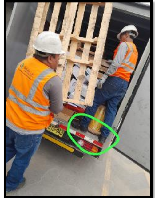
Materiales metálicos pesados apilados sin separaciones.